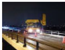
▲橋梁作業車による 作業の状況