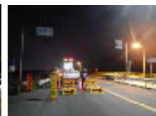
▲規制状況 (イメージ)