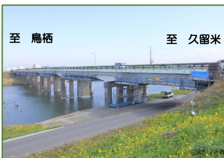
作業および規制時のイメージ