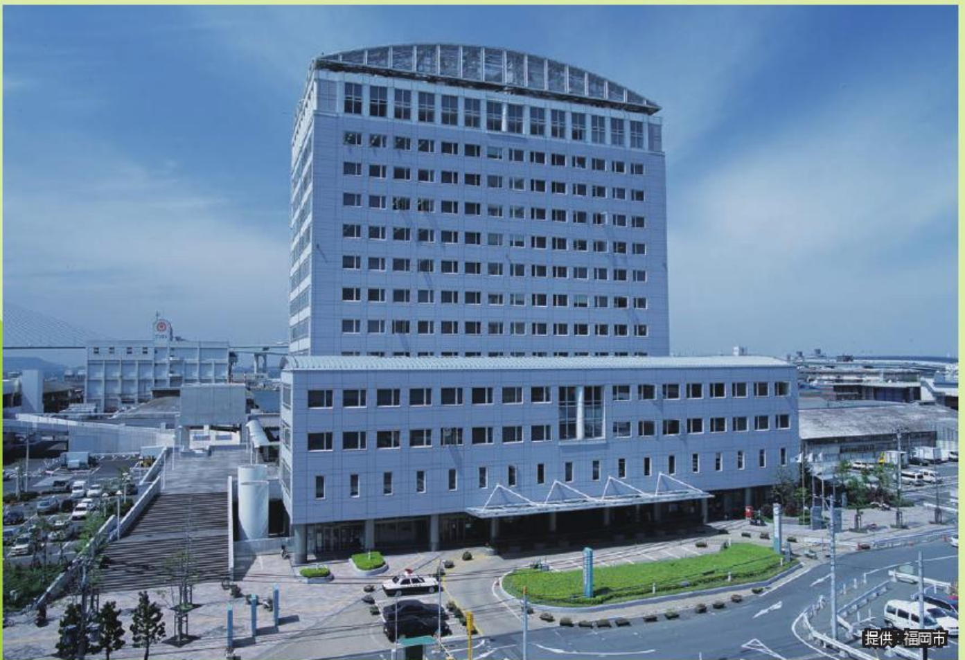
福岡市鮮魚市場 (福岡市中央区)