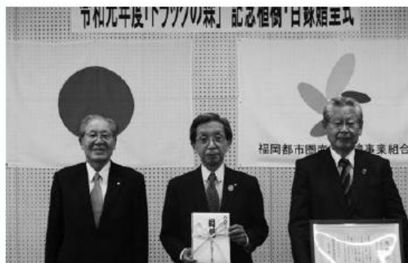
左から眞鍋会長、井本市長、三村副会長