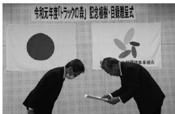
感謝状贈呈 (左:井本市長、右:三村副会長)