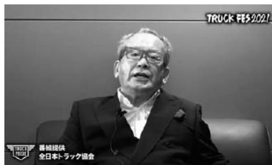
(坂本会長:全日本トラック協会)

ボリュームのあるステージパフォーマンスの合間に行われたトークショーでは、NRSを中心に出演者たちが自身とトラック運送業界との関わりなどについて語り合いました。