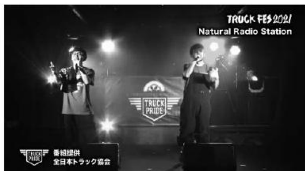
(Natural Radio Station)