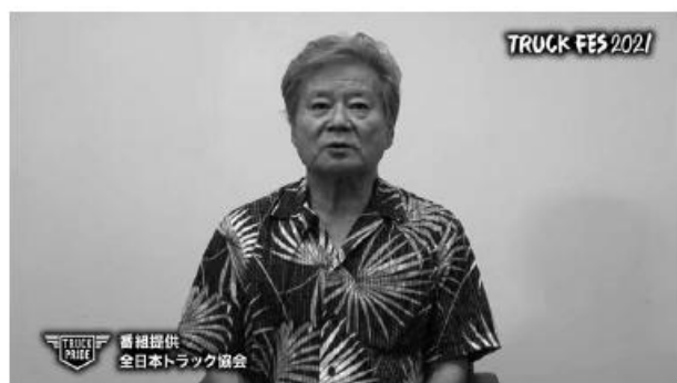
(佐次田広報副委員長)