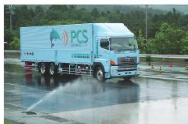
衝突被害軽減ブレーキを装着した大型トラック