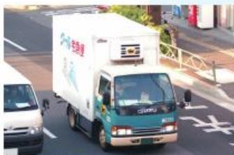
宅配便の年間取り扱回数36億回を超えた （平成25年度）