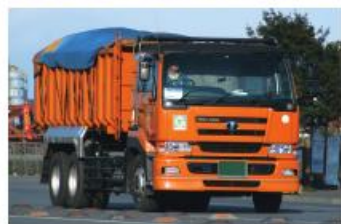
建築資材など重量物を運ぶダンプカー