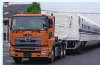
新幹線を輸送するトラック