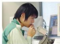
出発前のアルコールチェック

やはり運転をしているときに、一番充実していると感じます。これからもずっとトラックに乗っていたいと思います。