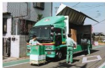
サービスが多様化する引越し輸送