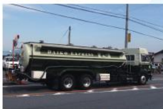
液体を運ぶタンクローリー