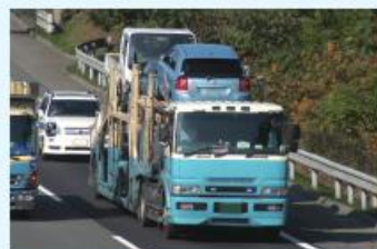
車の運搬を行うキャリアカー