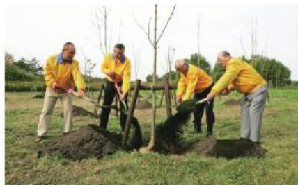
「トラックの森」づくり事業（北海道札幌市 茨戸川緑地）

このほか、地球温暖化対策の一環として森林保全のための「トラックの森」づくり事業、「美しい森林づくり全国推進会議」への参加など、植樹の取り組みを業界全体で行っています。