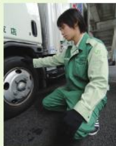
車両点検もドライバーの大切な仕事

私自身、高校ではやりたい仕事がなかなか決まりませんでした。また、自分に何ができるのかという不安もありました。でも縁あって今の会社に入り、先輩や同僚のみんなと充実した毎日を送っています。何事もやってみないとわからない。だから何でもやってみよう方がいいと思います。