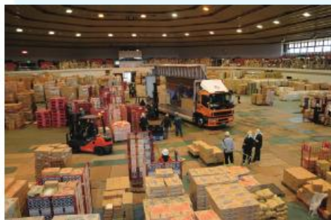
緊急物資第一次集積地（岩手産業文化センター アビオ）

トラック輸送は日々の暮らしを支えるだけでなく、災害発生時にも重要な役割を果たしています。平成23年3月11日に東日本大震災が発生すると、翌12日の未明には緊急物資輸送がスタート。同年6月末までに、被災地に飲料水460万本、食料品1,898万食、毛布46万枚を届けました。このほかにも各地での自然災害発生時には、トラックが優れた機動力を発揮し、いち早く支援物資を輸送しています。