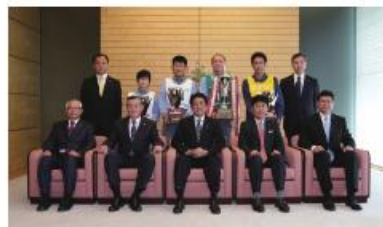
第45回全国トラックドライバー・コンテスト優勝者による内閣総理大臣表敬訪問

また、衝突被害軽減ブレーキや後方視野確認支援装置、EMS（エコドライブ・マネジメントシステム）などの新技術により安全性を高めた先進車両の導入助成の実施や、営業用トラックドライバーを総合的にサポートする施設「トラックステーション」の運営を全国で展開しています。