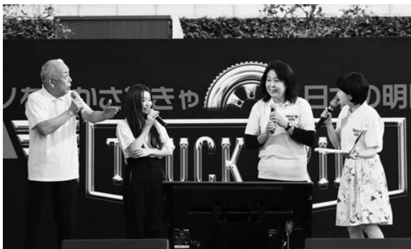
(聞いてみようトラックドライバーのあれこれ【女性編】)