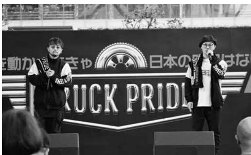
(Natural Radio Station)