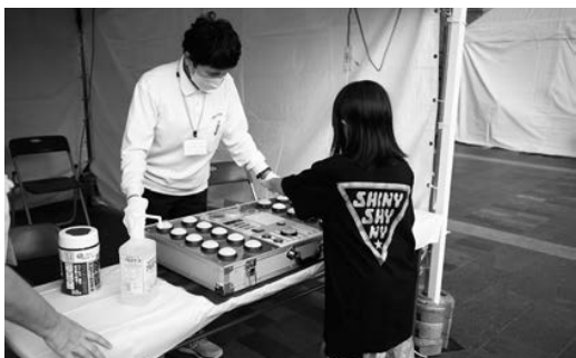
(反射体験コーナー)