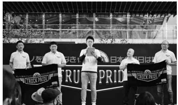
(青年協議会によるPR)