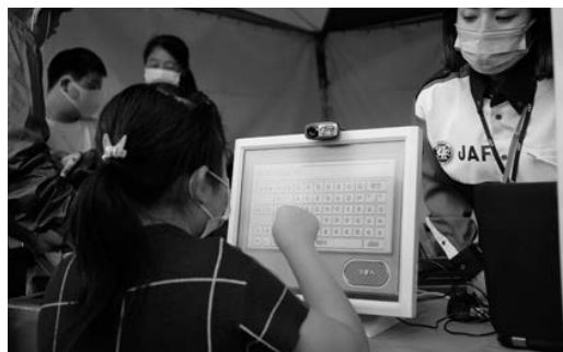
(子ども免許証発行コーナー)