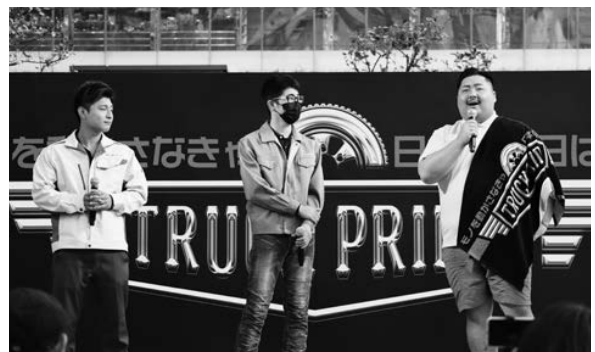
(聞いてみようトラックドライバーのあれこれ【男性編】)