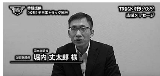
(堀内自動車局長：国土交通省)