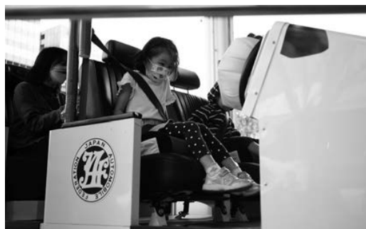
(シートベルトコンビンサー)