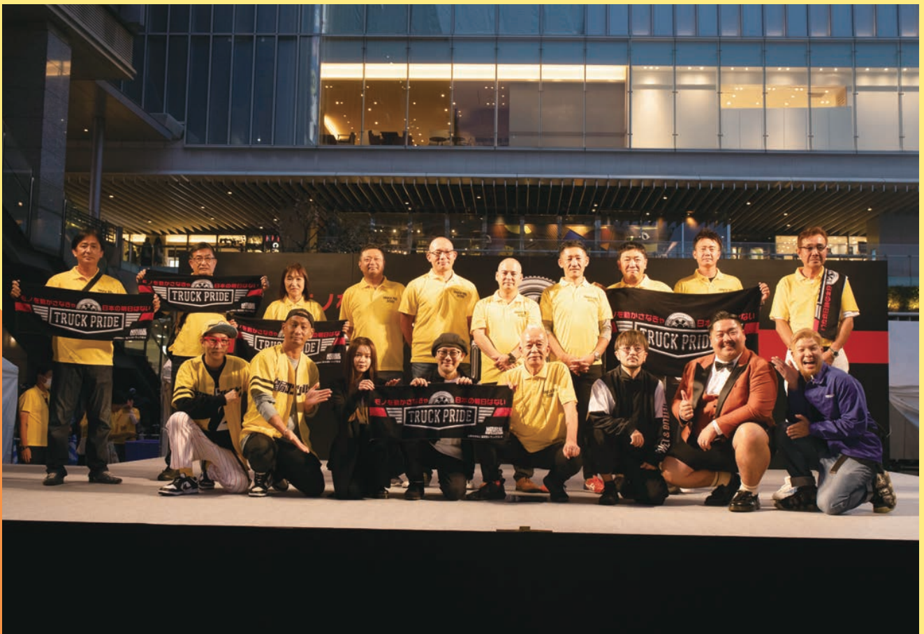
TRUCK FES 2022