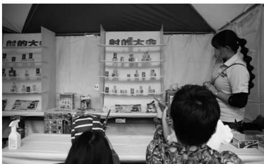
(縁日ブース：射的大会コーナー)

また、子供安全免許証作成や福岡県警察によるミニ白バイ乗車体験などもあり、記念撮影を楽しむ子供達や、日本自動車連盟によるシートベルトコンビンサー体験で想像以上の衝撃に驚きを隠せない観客など、大勢の人々で賑わいました。