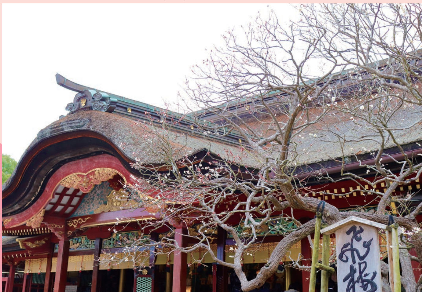
太宰府天満宮 本宮